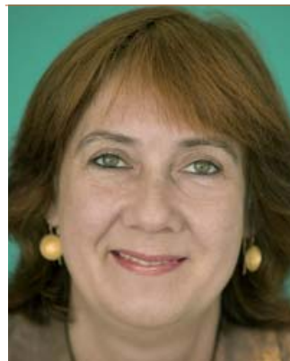
Karoline Linnert Fraktionsvorsitzende

Während der gesamten Legislaturperiode brachten wir rund 235 Anträge, 45 Große und 140 Kleine Anfragen in die Bürgerschaft ein. Wir haben 40 aktuelle Stunden bestritten, den Senat 260 mal in der Fragestunde gelöchert, über den Haushalt gestritten und die Regierung mit Misstrauensanträgen unter Druck gesetzt.